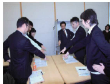
集合研修風景(イメージ)